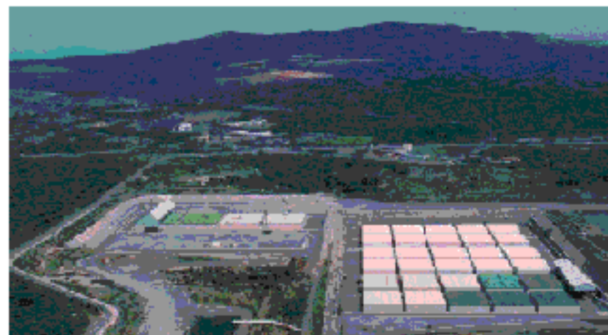
低レベル放射性廃棄物埋設センター