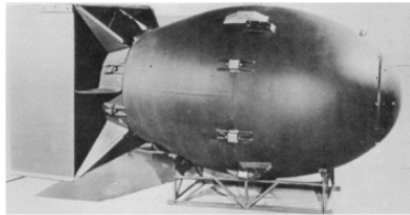
長崎に投下された原爆(Fat Man) (模型) (プルトニウムを用いた爆縮型原爆)

【出典】 Vincent C. Jones; The Army and the Atomic Bomb, Center of Military History, United States Army, Washington, D. C., 1985 など